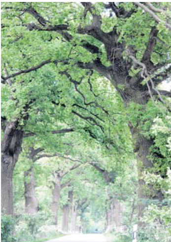
Diese wunderschöne Eichenallee nach Erenkamp ...