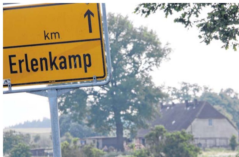
Wer glaubt, er hat - nach übrigens wenigen Sekunden - Erenkamp passiert, sieht sich getäuscht: Jenes Haus hinter dem Ortsausgangsschild gehört noch oder schon wieder zu Erenkamp. Ein Vorort sozusagen.