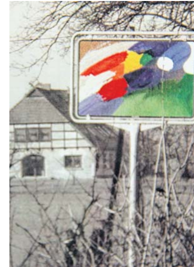
Und „Erenkamp“-Design für private Atelierfeste der Anfangszeit