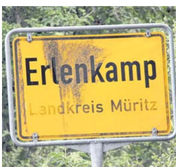
Willkommen in Wildkuhl - Verzeihung, Erenkamp!