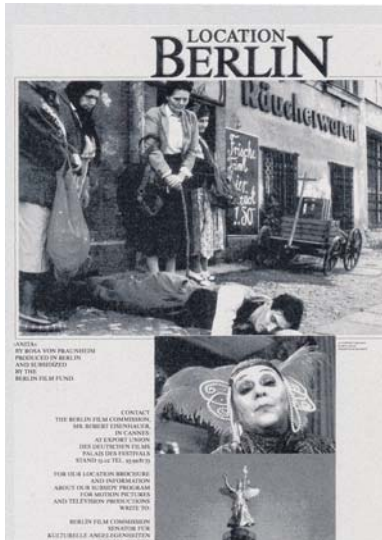
Design für die spannende „Filmlocation“ Berlin

oder das Jazzfest Berlin rundum erworben. Riesenempfang mit bis zu 700 Leuten am Zoopalast waren auszurichten, Begegnungen mit Stars aus Film wie Danny de Vito oder Politik wie Richard von Weizsäcker an der Tagesordnung. Für den Europäischen Filmpreis hat die Kulturagentur das Corporate Design entwickelt, verbunden mit Anzeigen für die internationale Fachpresse von Hollywood bis Moskau. Eine spannende Zeit, als noch Peter Stein mit seinen bis dahin nie gesehenen Inszenierungen die